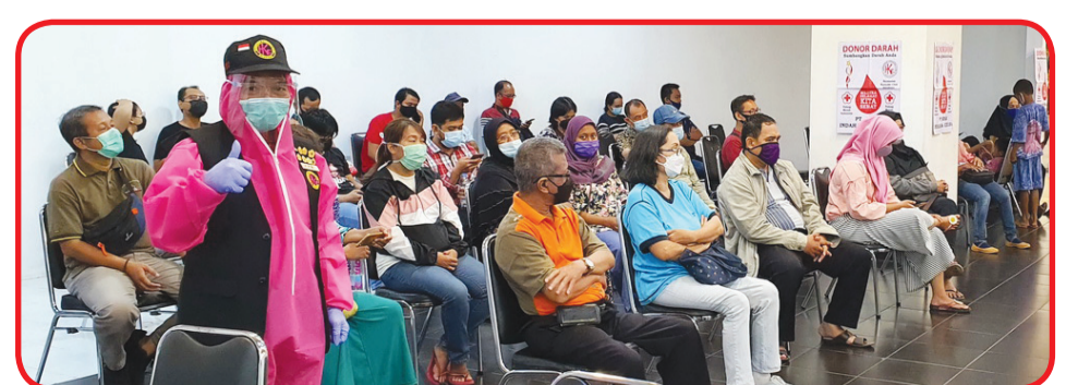
Warga mengantri untuk mendonorkan darahnya.

Dan gerakan ini akan kembali diadakan pada 24 Juli 2021 mendatang.