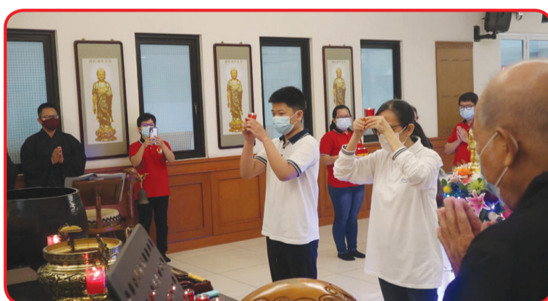
Pengurus Vihara Kesejahteraan Kosambi Baru melakukan ritual puja.