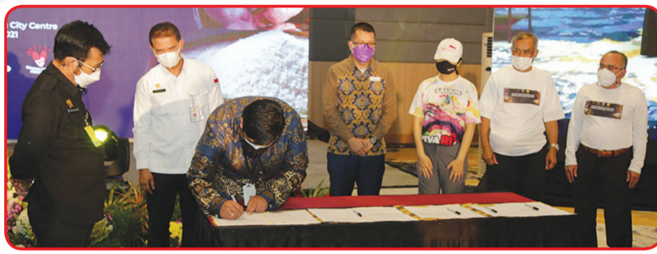
Prosesi penandatanganan kerja sama.

"Bahkan Accor di dunia ini lebih dari 5000 hotel. Jadi langkah pertama kita adalah memasukan produk pangan