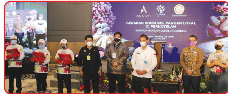
Mentan Syahrul Yasin Limpo berfoto bersama perwakilan grup perhotelan Accor.