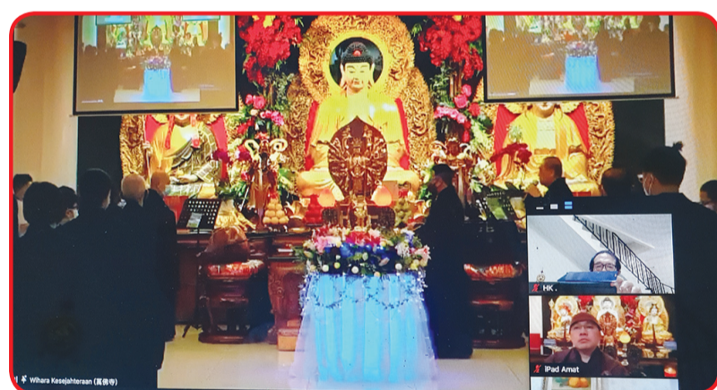
Ritual pembacaan sutra Buddha.

Oleh karena itu, jika ingin memiliki sikap welas asih, maka pertama-tama kita harus menanggung kesulitan. Hanya dengan bertahan dalam kesulitan, memahami kesulitan dan