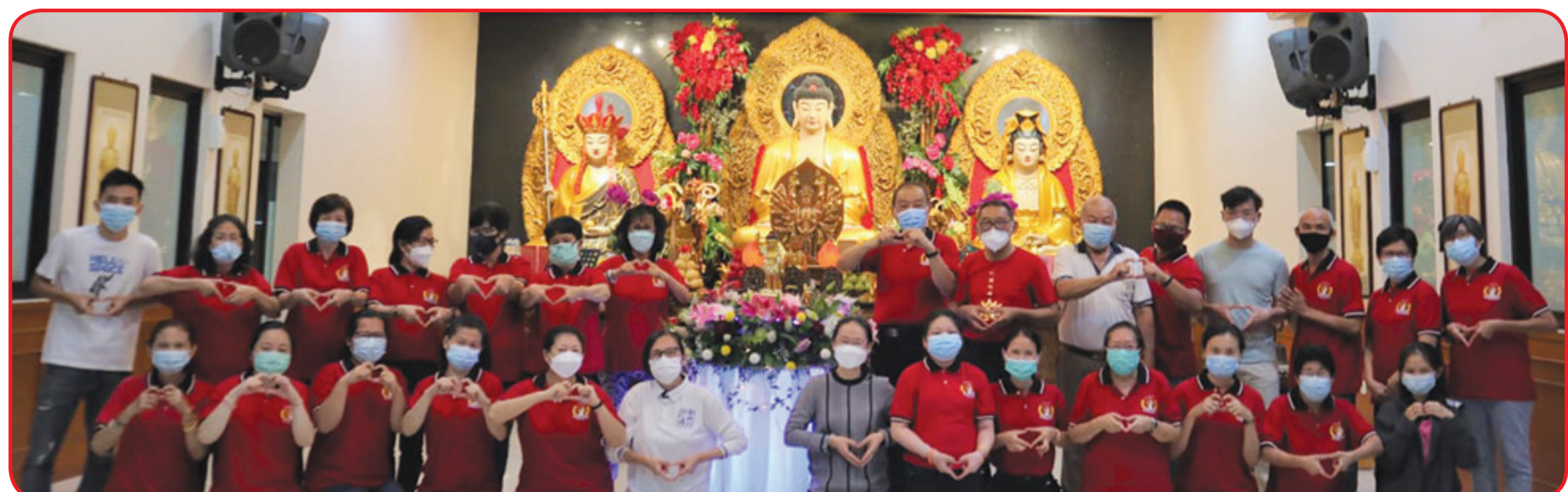
Pengurus Vihara Kesejahteraan Kosambi Baru dan relawan berfoto bersama.