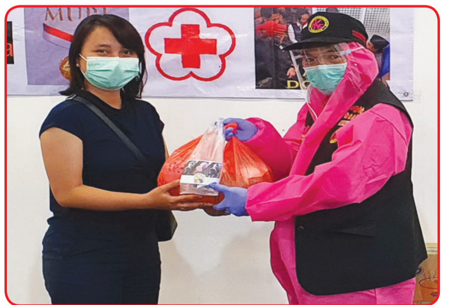
Penyerahan paket sembako secara simbolis.