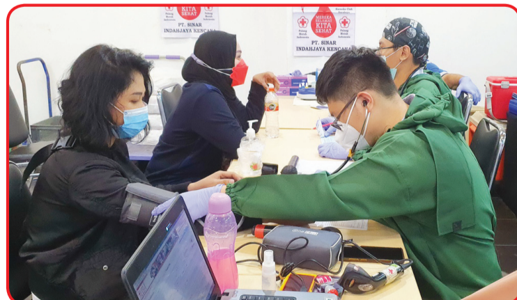
Petugas PMI Kota Surabaya memeriksa kesehatan calon pendonor.