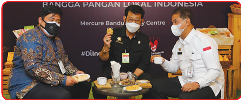
Mentan Syahrul Yasin Limpo (tengah) memperlihatkan produk pangan lokal.

lokal ke hotel-hotel Accor. Dan semua ini sudah kita mulai di Semarang dan akan merambat ke hotel Accor lainnya," katanya.