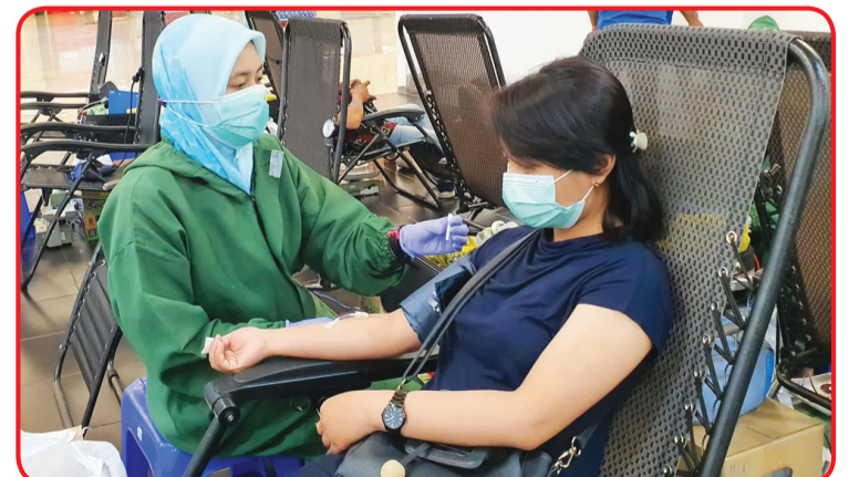
Seorang warga yang sedang mendonorkan darahnya.

SURABAYA (IM) - Harmonis Karaoke Club Bersama PT Sinar Indah Jaya Kencana mengadakan Gerakan Donor Darah dan Donor Plasma Konvalesen.