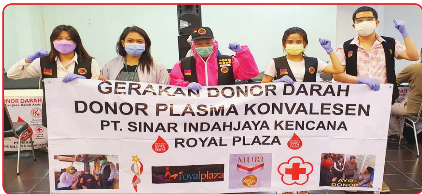
Panitia penyelenggara berfoto bersama.