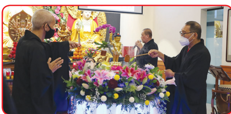
Pelaksanaan ritual pemandian Rupang Buddha.

Di hari yang suci ini, kita harus terus-menerus melakukan refleksi diri karena kita telah berbuat dosa melalui