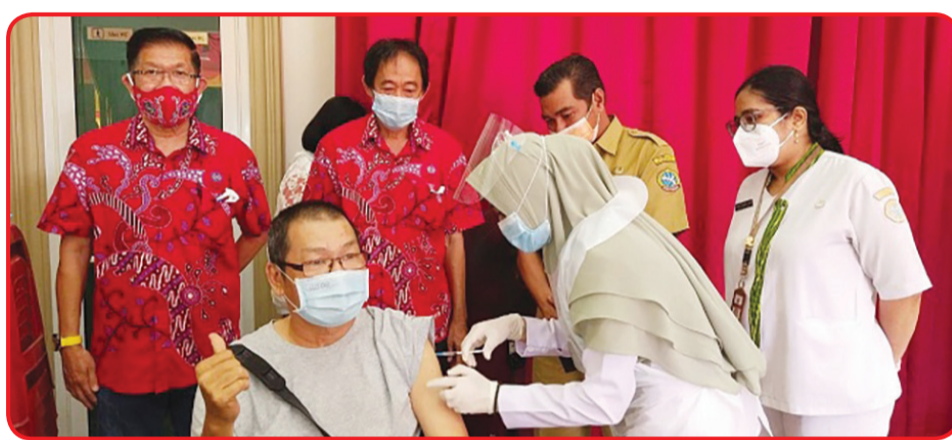
Program vaksinasi lansia yang dilaksanakan oleh Yayasan Bhakti Suci (YBS) Pontianak bersama PSMTI Pontianak beberapa waktu lalu.

Sidiq Handanu menambahkan, setelah tenaga medis dan petugas pelayanan publik, maka pasca lebaran program vaksinasi akan menyasar petugas atau pekerja di sektor