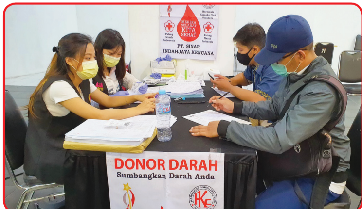
Warga antusias mendaftarkan untuk menjadi pendonor.